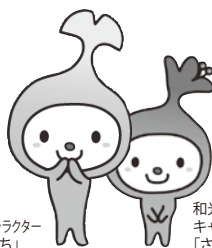
和光市 イメージキャラクター 「わこうっち」

尚、和光市議会を広く市民の方々に公開し、より開かれた議会を推進するために、開催中の市議会の音声及び画像を記録し、インターネット上で公開しています。録画中継は、原則として本会議の翌日から起算して5日（土日を除き）以降に配信することになっています。