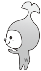
和光市 イメージキャラクター 「わこうっち」

※下水道事業会計については、平成26年度から地方公営企業法が全部適用される公営企業会計となります。